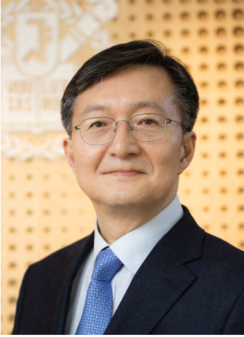
서울대학교 총장 유 홍 립

한국 사회의 가속화되는 인구 고령화 과정 에서 시니어 계층은 거대 인구집단으로의 성장을 예고하는 동시에 시장경제 중심에서 신 소비파워 계층으로 등장했습니다. 이러한 고령 인구의 증가는 개인의 삶 뿐만 아니라 사회 전반에 걸친 모든 변화를 주도하게 될 것입니다.